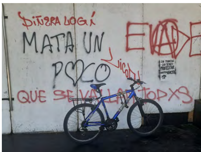
Figura 5. Muros y graffitis. Plaza Dignidad, noviembre 2019.