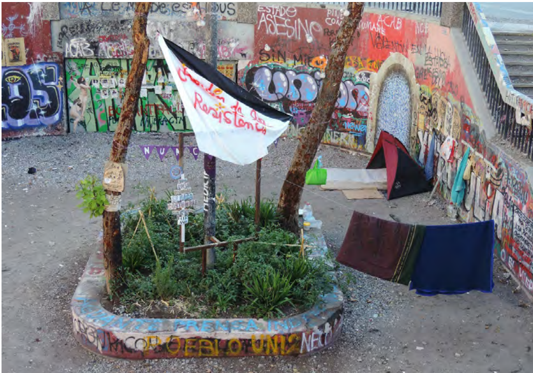
Figura 10. Jardín de la Resistencia, Plaza Dignidad, Santiago.

en este jardín, adornado con cintas de colores, enaguas blancas bordadas con los nombres de las mujeres muertas o los ojos de los mutilados, entre los escombros de la plaza se crean nuevas formas de evocación, afectivas y no discursivas. Son las figuras fantasmagóricas que rondan por el entorno (Espinoza, 2019; Gordillo, 2018) obligándonos a aprender a convivir con ellas. Tal como señala Navaro-Yashin (2009), los objetos derruidos liberan energías emotivas; en especial, para quienes habitan u ocupan los entornos. En estos términos, todo proceso de ruñificación o ruñación (Errázuriz y Greene, 2018), entendido como material o artefacto objeto de destrucción o violencia, gatilla subjetividades y afectos residuales.