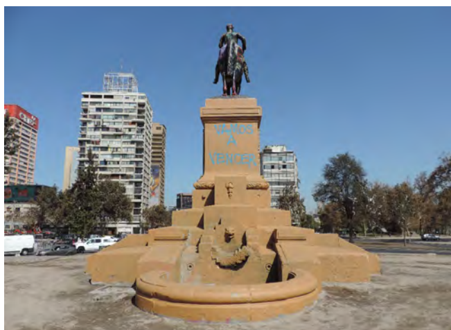
Figura 9. Monumento al general Baquedano limpio de madrugada por las autoridades, pero tempranamente contestado por manifestantes: “Vamos a vencer”. 19 de marzo 2020.