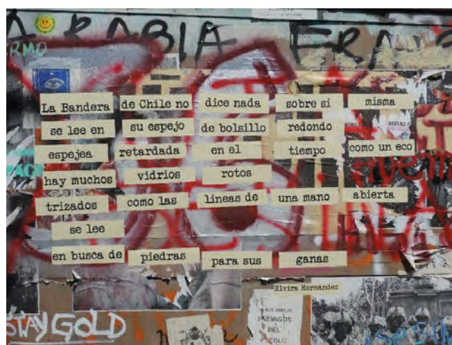
Figura 6. Textos en muros del entorno de Plaza Dignidad.

fantasmagóricos. El secreto mejor guardado por la industria del patrimonio nos señala Gordillo (2018) es que sus ruinas son escombros que han sido fetichizados. En Chile, la revuelta social los ha delatado. Estas disputas son un buen ejemplo de cómo el fetiche y sus desplazamientos significantes están históricamente situados y, por ende, irremediabilmente participan de campos de intereses en pugna.