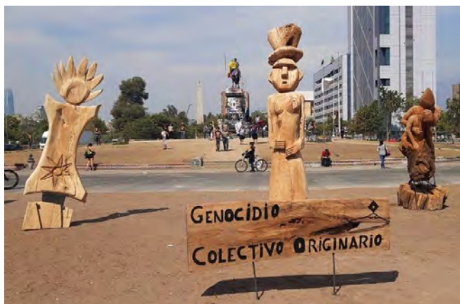
Figura 8. Museo a cielo abierto.

Un jardín que crece y asombra entre los escombros, invitando a descender para contemplarlo y oler sus aromas. La distopía transformada en un paisaje amablemente verde convierte las formas y las texturas de la ausencia, de la incompletitud y el vacío, en la celebración de la vida. Como