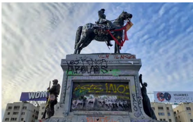
Figura 7. Escultura de Manuel Baquedano, Plaza Italia, Santiago, octubre 2019.

de los escombros se vuelve caminable, obligatoriamente caminable, porque ni el metro que ardió, ni los buses seriamente averiados, logran trasladar a los miles de pasajeros transformados de un día al otro, en peatones.