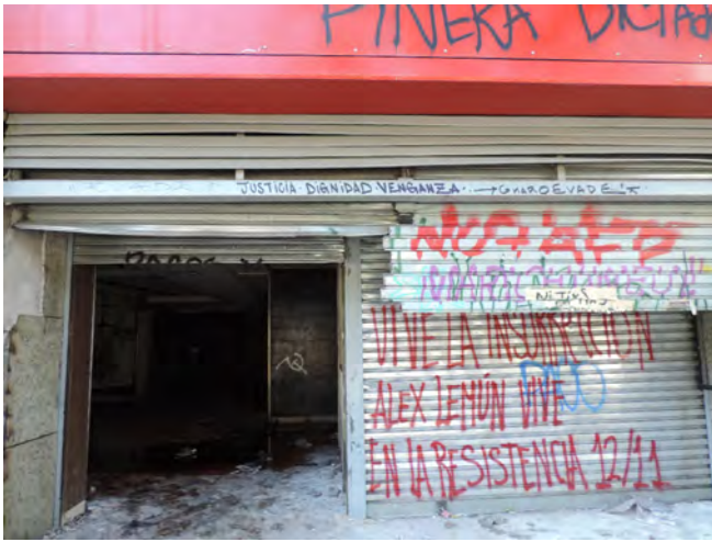
Figura 4. Banco saqueado. "Justicia. Dignidad. Venganza. Evade/ Vive la insurrección. Alex Lemún vive en la resistencia 12/11".

(re)pensarlo y develar su espesor significativo. Como las sillas del restaurante saqueado que luego se transformarán en material de barricadas; o los bancos de madera de las iglesias que luego arderán como hogueras; o las tapas de alcantarillado que manos hábiles transformarán en escudos para los jóvenes de la primera línea .