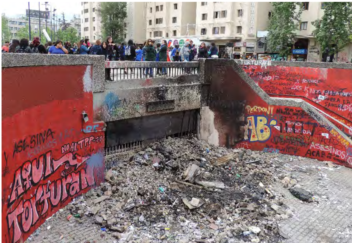
Figura 1. Escombros metro Baquedano: "Aquí torturan". Santiago, octubre 2019.

Una segunda premisa señala que la clave de este proceso de desestabilización no está en la condición de artefacto ruinoso o derruido que el estallido social deja tras de sí, sino en los procesos iterativos de desplazamiento del escombro al artefacto reconstruido y del artefacto reconstruido al escombro. En este proceso de destrucción y reconstrucción iterativa, se movilizan y entrelazan agencias históricas y culturalmente situadas. Es en esta temporalidad de la historia y de la memoria, que la especificidad de la destrucción de un sistema que se quiere borrar, hace su aparición. En este ir y venir, tanto la historia como la cultura participan desde una densidad significativa, dejando espacio para la participación de la