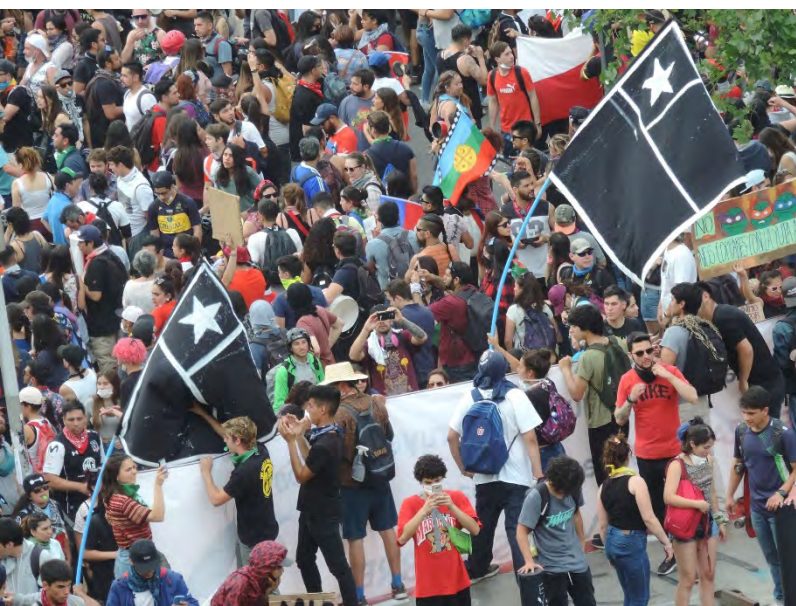
Figura 2. Jóvenes y banderas negras en Plaza Baquedano, octubre 2019.

imaginación, la magia de la mimesis y los sentidos sobre esta materialidad (Taussig, 2002). De allí la importancia de observar los escombros del estallido social como aquellos nodos/confluencia e hitos/referentes urbanos (Lynch, 1965) críticos donde convergen los cuerpos, los bienes, los dioses, el arte, las leyes, los antepasados, los animales, las creencias y las ideologías (Ingold, 2000).